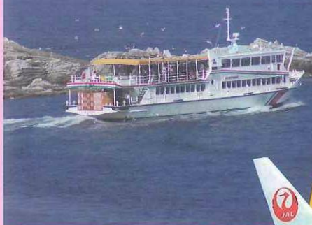
宮古：浄土ヶ浜遊覧船

■発売・利用開始：平成25年3月31日～（発売開始以降、乗車予定日の1ヵ月前から購入可能）